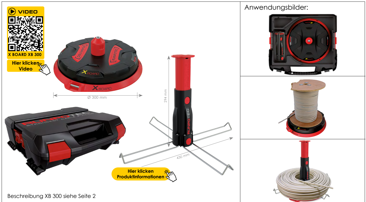
Beschreibung XB 300 siehe Seite 2