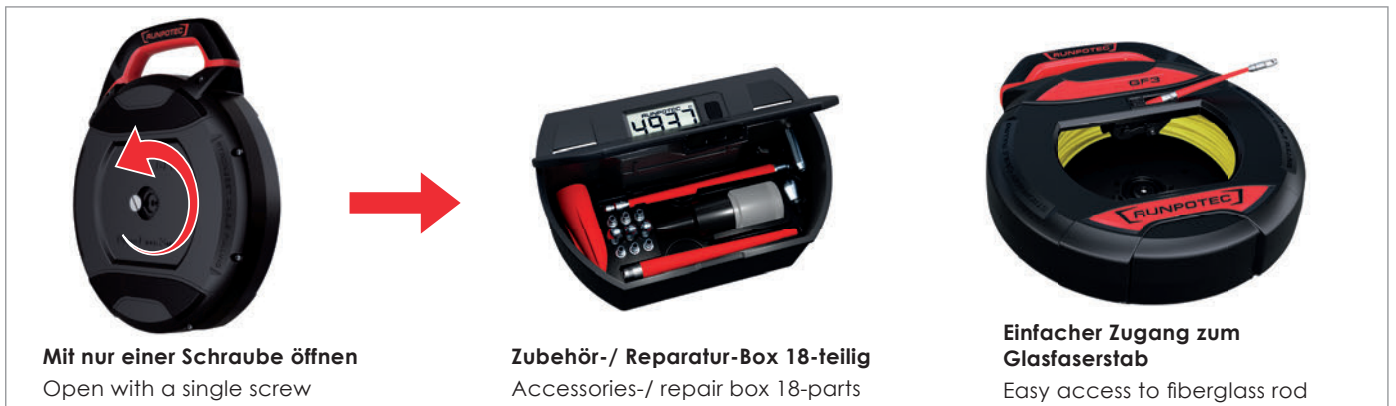
Mit nur einer Schraube öffnen Open with a single screw