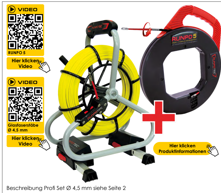
Beschreibung Profi Set Ø 4,5 mm siehe Seite 2